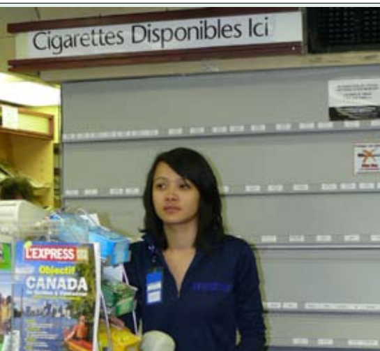
On ne voit plus les cigarettes dans les commerces depuis juin 2008, bien que leur vente y soit demeurée généralement très apparente.