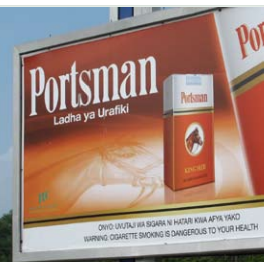
Annonce actuelle de cigarettes en Tanzanie, comme on en voyait au Canada avant 1989.