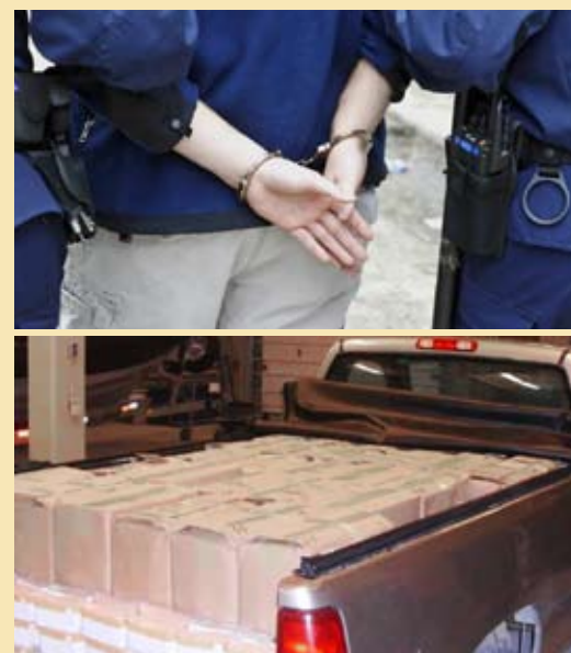
À force d'arrestations et de saisies, la contrebande du tabac aurait baissé à moins de 20 % du marché au Québec, selon l'ADA.

D'autre part, sous le titre « La contrebande recule de façon importante! », dans l'édition de novembre-décembre de sa revue RADAR , l'Association des détaillants