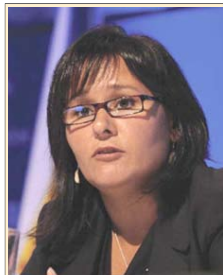
La ministre fédérale de la Santé, Leona Aglukkaq, a reconnu que d'autres initiatives antitabac retenaient présentement son attention.

« Le gouvernement du Canada est résolu à réduire le tabagisme chez les jeunes, à aider les Canadiens à arrêter de fumer, et à s'attaquer au problème urgent du tabac de contrebande. Le gouvernement a récemment adopté des mesures sur tous ces fronts. Par exemple, avec l'entrée en vigueur le 5 juillet 2010 de la Loi restreignant la commercialisation du tabac auprès des jeunes, l'industrie du tabac aura plus de difficulté à inciter les jeunes à consommer ses produits. »