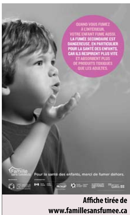
Affiche tirée de www.famillesansfumee.ca

des nausées. Quand l'exposition est prolongée, la toux, les crises d'asthme, la bronchite et la pneumonie sont plus souvent au rendez-vous dans les familles enfumées que chez les autres.