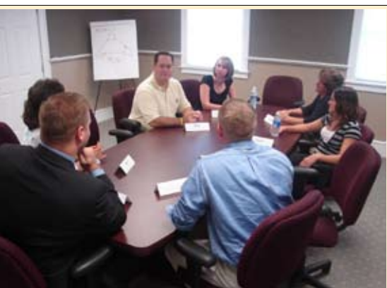
Santé Canada a dirigé de nombreuses études et réunions afin de concevoir une nouvelle génération de mises en garde sur le tabac.

➔ plus grave problème lié au tabagisme est celui de la contrebande. « C'est pourquoi je pense qu'il est important que Santé Canada concentre ses efforts sur la lutte contre la contrebande du tabac. »