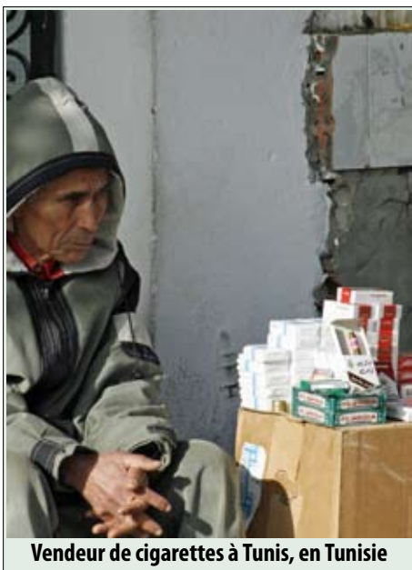
Vendeur de cigarettes à Tunis, en Tunisie

Elles se sont penchées sur l'ensemble des sujets pour lesquels des décisions devaient être prises portant entre autres sur : la taxation, les avertissements sanitaires sur les paquets, l'éducation et la formation, l'aide au sevrage, la protection de l'environnement et la responsabilisation de l'industrie. Les organisateurs de cet atelier se sont montrés confiants dans l'influence que démontreront les délégations africaines d'ONG auprès des représentants de leur continent.