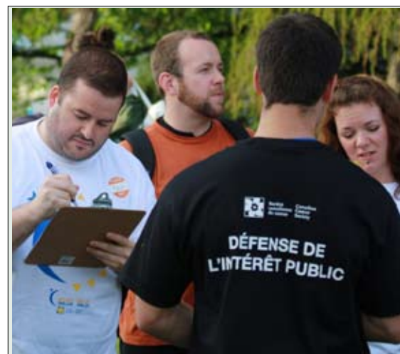
Envoyée au ministre Bolduc par l'entremise de députés, la lettre de la Société canadienne du cancer fut endossée par 22 276 Québécois.