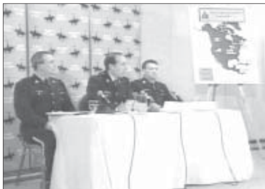
À Toronto, fin février, des officiers de la GRC expliquent aux médias la route de la contrebande qu'aurait concoctée les dirigeants de RJ-Reynolds.

Les accusations furent dévoilées par la GRC en conférence de presse à Toronto le 28 février. Puis, le 26 mars, la plupart des suspects ont brièvement comparu en cour, au vieil hôtel de ville torontois. À cette étape, les accusés n'avaient pas à admettre ou non leur culpabilité. Néan-