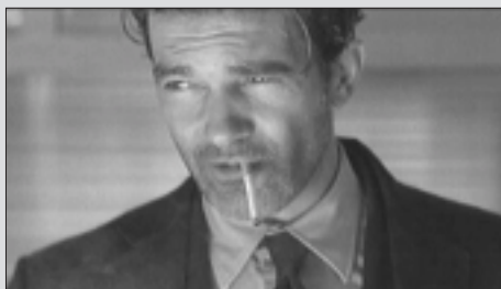
Ballistic : Ecks vs Sever , avec Antonio Banderas

Environ le tiers des nouveaux films analysés par les bénévoles de SceneSmoking.org obtiennent la cote « poumon noir », car ils montrent des scènes fréquentes de tabagisme, sans en révéler de méfaits. Voici trois exemples produits en 2002.