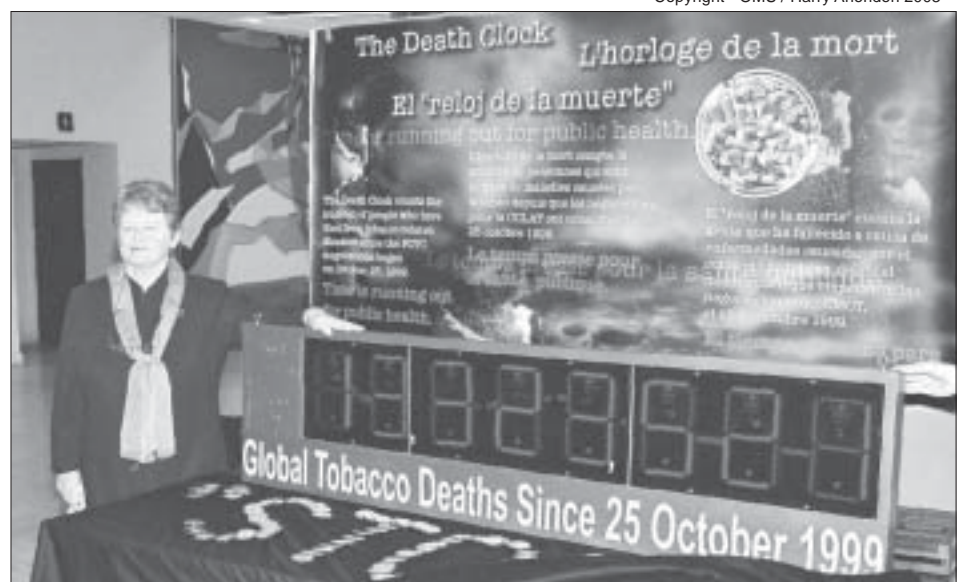
Gro Harlem Brundtland, directrice de l'OMS, pose devant l'horloge de la mort.

Indiquant « 13 323 521 décès » au 17 février, ce mécanisme estime le nombre de personnes tuées par le tabac sur Terre depuis le début des négociations de la Convention-cadre, en 1999.