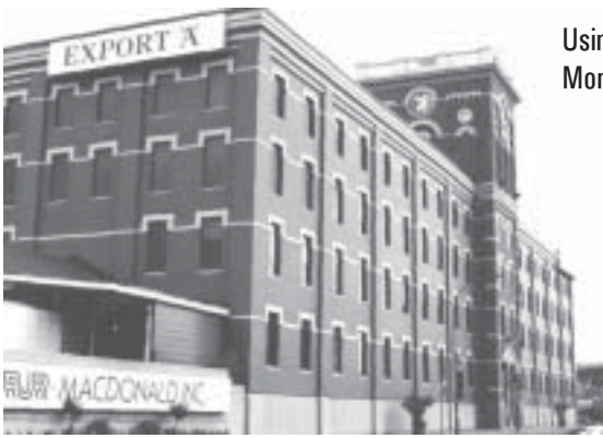
Usine de JTI-Macdonald, dans l'est de Montréal. Auparavant RJR-Macdonald.

➡ au Canada et à Puerto Rico, sachant que ces cigarettes étaient distribuées illégalement au pays. « En tant que contribuables, nous payons tous pour ces fraudes , a indiqué l'officier Robert Davis de la GRC. Nous payons pour les pertes de recettes qui auraient dû financer nos programmes sociaux visant à soutenir nos aînés, instruire nos enfants et s'occuper des malades et des personnes moins fortunées. »