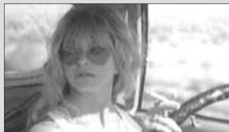
The Banger Sisters , avec Goldie Hawn.