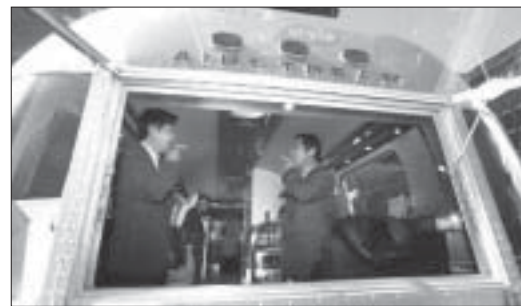
À Tokyo, Japan Tobacco a aménagé des roulottes pour fumer, les SmoCar.