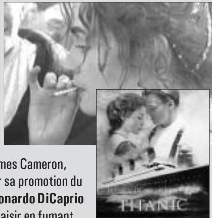
Chef d'oeuvre du réalisateur canadien James Cameron, Titanic , sorti en 1997, est souvent cité pour sa promotion du tabagisme. Les amoureux, interprétés par Leonardo DiCaprio et Kate Winslet , semblent avoir bien du plaisir en fumant.

triple les probabilités qu'un jeune essaie de fumer».