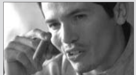
Empire , avec John Leguizamo