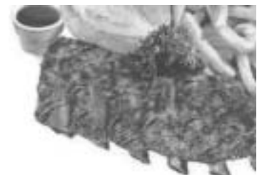
Plats du Chalet Suisse, servis sans FTE

Le Chalet Suisse du 375 boulevard Hamel, à Vanier, est ouvert sept jours par semaine, même pour le petit déjeuner. On peut le joindre au téléphone au (418) 527-3475. Il devient le 54 e établissement à figurer sur notre liste des restaurants québécois totalement sans fumée, avec service aux tables, présentée à www.info-tabac.ca/restaurants.htm .