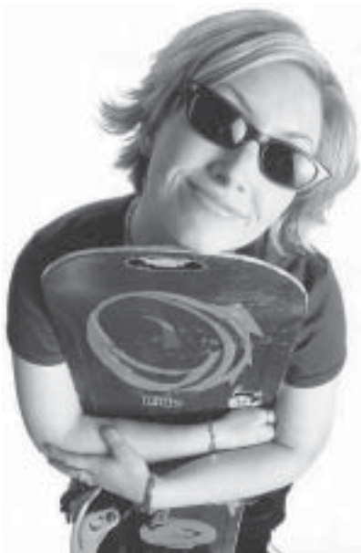
Cette photo apparaît sur une affiche de la Semaine. Au tour des groupes de santé d'utiliser des images de style de vie !