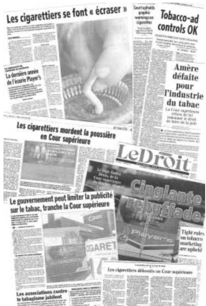
Le jugement fut bien couvert par les quotidiens du lendemain.

Dans son jugement de 196 pages, remis à son bureau aux avocats impliqués le 13 décembre à 8h15, le juge André Denis s'est montré particulièrement cinglant envers l'industrie du tabac. Ses conclusions (reproduites en page 2) se terminent ainsi : « La preuve faite en l'instance oblige la Cour à faire preuve d'une retenue que le sens commun impose. Les actions des demanderessees ne sont pas fondées. » C'est donc vers 8h17, en tournant