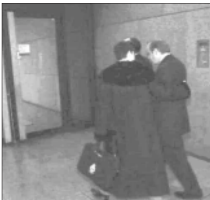
Décus, des avocats de l'industrie quittent le Palais de Justice.

Officiellement, la cause fut entendue à Montréal parce qu'Imperial Tobacco y a son siège social ; ce géant détient près de 70 % du marché canadien des cigarettes usinées. Les deux autres grands fabricants ont les leurs à Toronto. Le trio croyait sans doute obtenir une oreille plus clémente d'un juge francophone. Ce qui n'a pas été le cas.