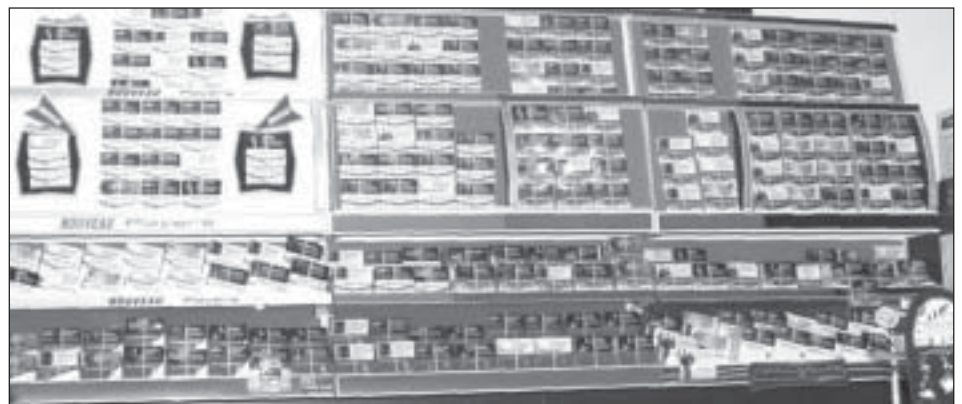
Après la Saskatchewan, le Manitoba défend à son tour les étalages de cigarettes. Cela met fin aux murs promotionnels, tel celui-ci photographié au Québec.