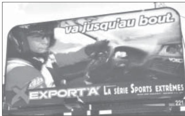
Cette annonce d'Export 'A' fut l'une des dernières affichées sur les panneaux extérieurs, avant l'étape d'octobre 2000.