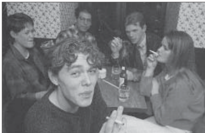
Les jeunes francophones fument davantage que leurs compatriotes anglophones.

Le portrait de la consommation de cigarettes chez les francophones soulève beaucoup d'inquiétudes. Ces derniers présentent les taux de tabagisme les plus élevés au Canada (35%). De plus, ils fument plus de cigarettes par jour que les anglophones et la teneur en nicotine de leurs cigarettes est en moyenne 20 % plus élevée. 2