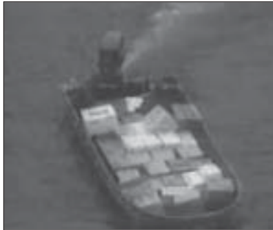
Les réseaux de contrebande étaient pleinement alimentés par les trois fabricants canadiens.

D'autre part, à la mi-février, RBH a confirmé s'être totalement dégagée de son ancien actionnaire principal, Rothmans International, dont la participation a été vendue à un syndicat financier de 10 sociétés, incluant la Financière Banque Nationale. Cette transaction avait été rendue nécessaire à la suite d'une directive du Bureau fédéral de la concurrence, lequel n'acceptait pas que le propriétaire d'Imperial Tobacco, BAT, contrôle aussi son principal concurrent, après avoir acheté Rothmans International. Un autre géant mondial du tabac, Philip Morris, détient toutefois encore 40 % de RBH.