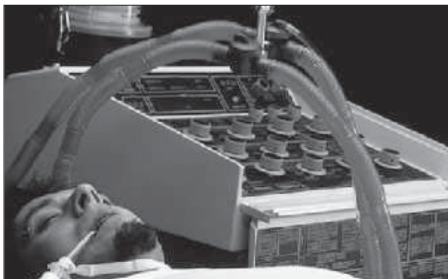
Santé Canada a estimé, pour l'année 1991, à 2,5 milliard $ les coûts du traitement des maladies liées au tabagisme.