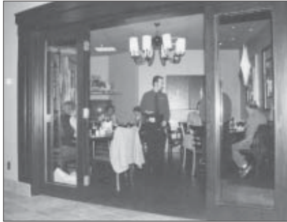
Une nouvelle rôtisserie St-Hubert offre à ses clients fumeurs des salles séparées, comme celle-ci, avec aération indépendante.