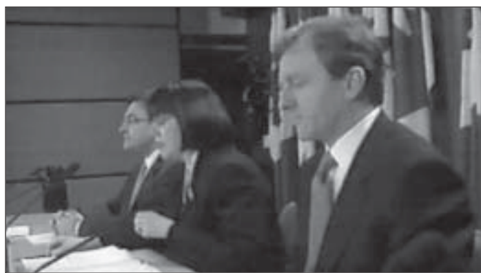
Les ministres fédéraux Martin Cauchon , Anne McLellan et Allan Rock expliquent la poursuite d'un milliard US $ contre JTI-Macdonald et le Conseil canadien des fabricants.

La poursuite fédérale fait actuellement face à une sérieuse embûche, car elle est intentée en vertu d'une loi américaine connue sous le nom de Federal Racketeer Influenced and Corrupt Organizations (RICO). Or, en février, la Cour suprême des États-