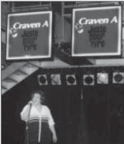
À vendre également : la relève Craven 'A' Juste pour rire.

À part les marques Craven "A" et Rothmans, RBH fabrique un grand nombre de très petites marques, souvent relativement anciennes, que la compagnie continue de produire malgré les coûts engendrés, par peur de perdre des consommateurs au profit d'Imperial Tobacco. Contrairement à RJR-Macdonald, qui perd des parts de marché depuis des années, RBH se maintient relativement bien.