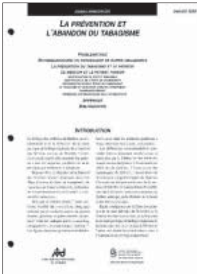
Les 17 000 médecins du Québec ont reçu ce cahier de Lignes directrices contre le tabagisme.

Les différentes étapes de changement sont abordées à tour de rôle en insistant sur les éléments d'intervention propres à chacune de ces étapes. De plus, on discute brièvement du tabagisme et de quelques groupes spécifiques comme les femmes en-