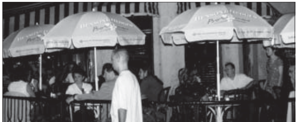
Messages contradictoires : à deux pas des bureaux de la Régie régionale de la Santé et des Services sociaux de Montréal, ce restaurant arbore des parasols Benson & Hedges, qui ont pour prétexte l'exposition de Borduas au Musée d'art contemporain. Autre commanditaire de cette intéressante exposition : le gouvernement du Québec...

Autre petit détail intéressant : les participants aux groupes de discussion torontois se préoccupaient peu des retombées économiques d'éventuelles restrictions touchant les commandites. Par contre, ils croyaient que la survie de certains événements qui leur étaient chers était effectivement menacée par la Loi sur le tabac .