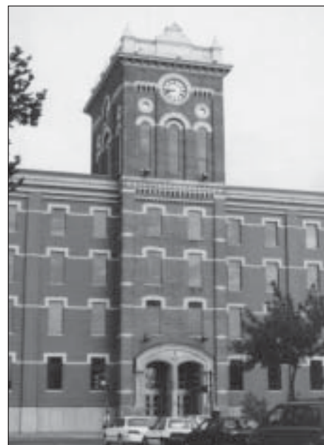
RJR Macdonald nie toute complicité avec la contrebande des cigarettes...

Depuis plusieurs années, les organismes de santé accusent l'industrie du tabac d'avoir contribué à l'explosion de la contrebande dans le but de forcer une diminution des taxes.