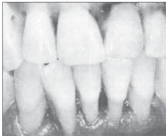
Le tabac sans fumée, comme d'ailleurs l'usage de la cigarette, est mauvais pour la santé dentaire, provoquant souvent une récession localisée des gencives. Dans ce cas-ci, on voit un exemple de périodontite plus généralisée chez un fumeur.

Le lien entre l'utilisation du tabac sans fumée et les cancers de la bouche ne sont plus à démontrer. Les leucoplasies, qui peuvent apparaître sur la joue, la gencive