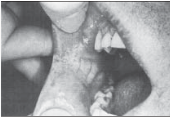
Les leucoplasies, plaques blanches qualifiées de précancéreuses, sont très fréquentes chez les utilisateurs de tabac sans fumée.

dans une petite canette contenant une vingtaine de sachets. L'autre forme de tabac sans fumée, le tabac à chiquer ( chew ou chaw ), est disponible en feuilles de tabac, en palettes ( plugs ) ou en tabac tressé ( twist, wads ).