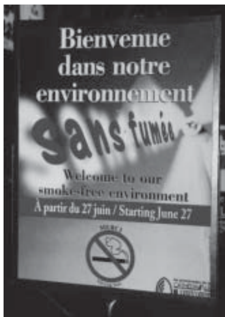
Avec seulement deux semaines de préavis, les Promenades de la Cathédrale ont très bien réussi leur transformation.