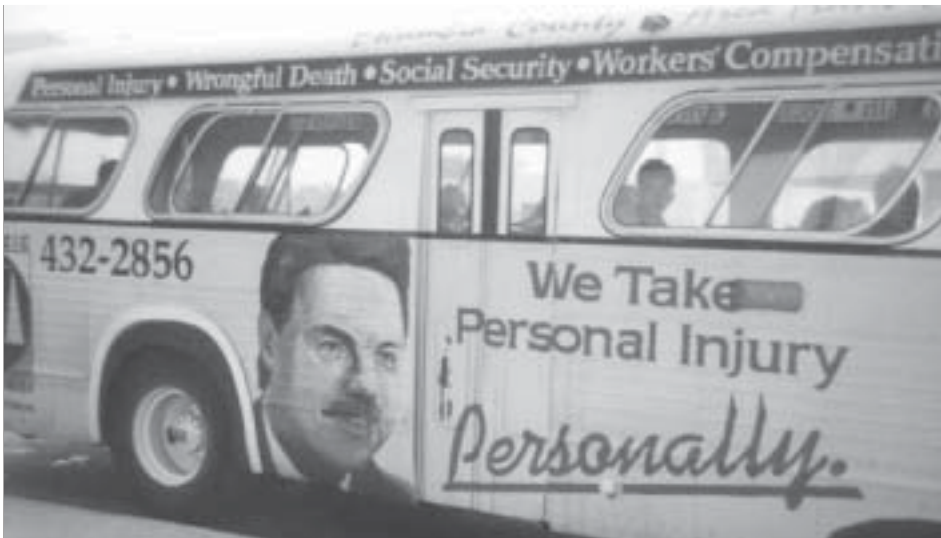
De nombreux avocats américains très déterminés se spécialisent dans les poursuites médicales, tel ce personal-injury lawyer qui s'annonce sur les autobus de Floride.

de la FDA de réglementer les taux de nicotine ; avant d'obliger les cigarettiers à réduire ces taux, l'agence fédérale devait démontrer que cette réduction ne créerait pas de problème de contrebande.