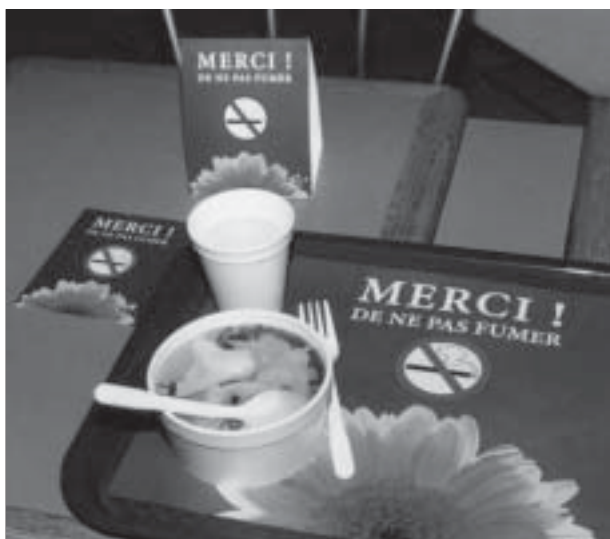
Au 2020 University, la soupe Wong Tong est encore meilleure depuis le 1 er juin, maintenant qu'on peut la déguster dans un environnement sans fumée.