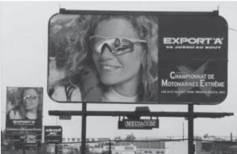
Tenue les 15 et 16 août sur la Baie Georgienne, en Ontario, une course de motomarines Export 'A' est l'événement le plus annoncé au Québec !