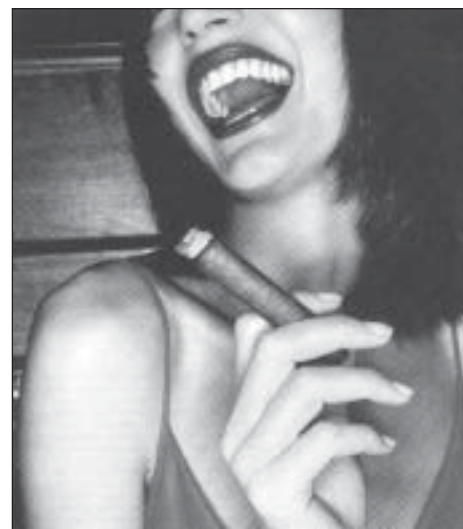
Cinéma et publicité aidant, l'industrie du tabac a quelque peu réussi à faire croire qu'il était de bon ton pour les femmes modernes de fumer le cigare !

Si c'est ça la solution, les pomiculteurs seront heureux et les marchands de mort qui sont les compagnies de tabac vont peut-être se recycler et acheter des vergers.