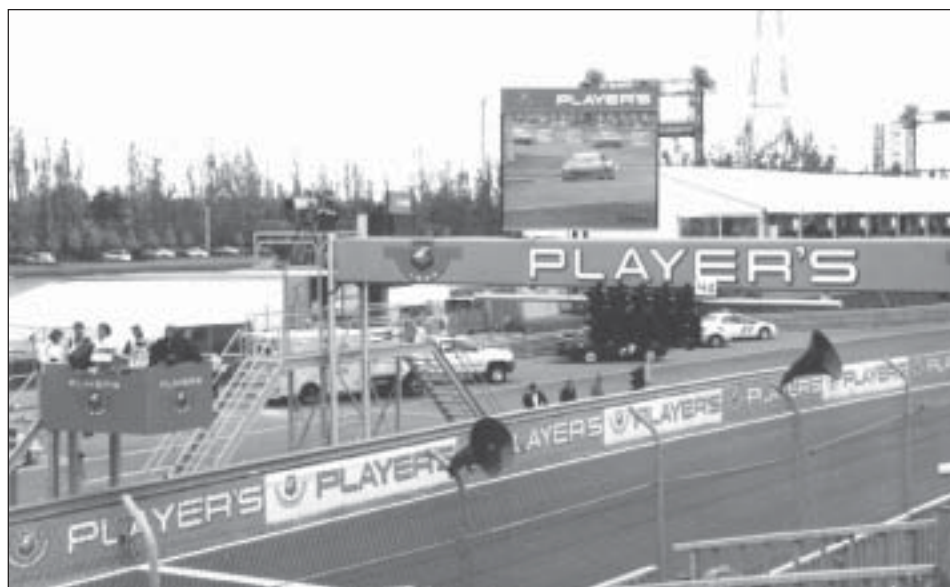
Devinez qui était le commanditaire principal du dernier Grand Prix du Canada !

Pourtant, la prise de position de l'Ordre des pharmaciens ne date pas d'hier. Dès 1984, il recommandait à ses membres de cesser le commerce du tabac sur une base volontaire ; en 1991, le Bureau de l'Ordre a proposé des modifications au code de déontologie des pharmaciens rendant cette mesure obligatoire. Mais faute d'un décret gouvernemental acceptant la modification, cette interdiction n'a jamais été mise en vigueur.