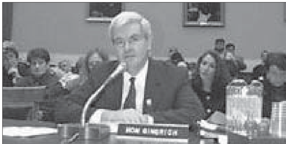
Newt Gingrich , le très conservateur président républicain de la Chambre des représentants, s'oppose aux hausses de taxes sur le tabac.

Le leader parlementaire des démocrates au Sénat, Tom Daschle, est allé jusqu'à accuser la majorité républicaine d'avoir « fusionné avec RJR », la compa-