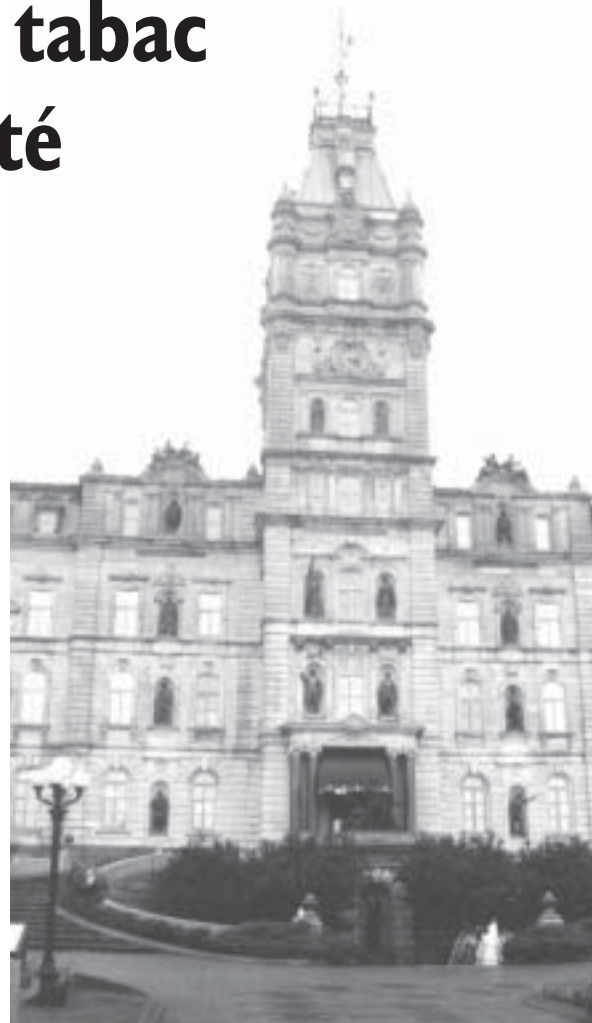
À l'Hôtel du Parlement le 17 juin vers 11h30, péquistes et libéraux ont fait la trêve pendant quelques minutes pour adopter la loi 444 : 108 pour, 0 contre, 0 abstention.

Le ministre a été contraint de reculer sur deux points importants. Suite aux menaces des cigarettiers concernant une éventuelle délocalisation de leurs usines à l'extérieur du Québec (voir notre dernier numéro), M. Rochon a accepté d'inscrire