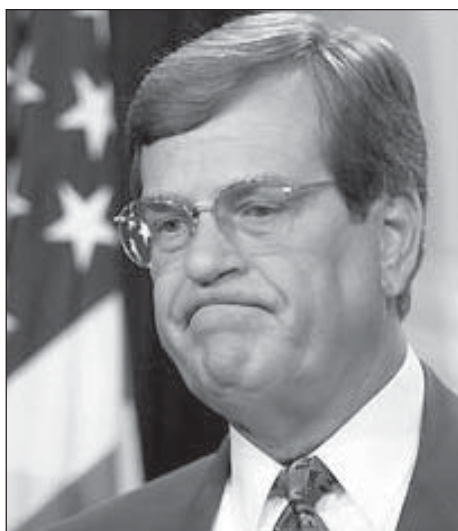
Le sénateur républicain Trent Lott a donné le coup de grâce au projet McCain

gnie de tabac qui a mené la campagne contre le projet de loi.