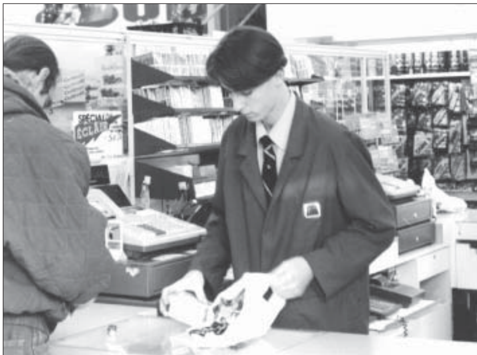
Même les franchisés du groupe Jean Coutu hésitent maintenant à vendre des cigarettes, suite à la défaite du célèbre pharmacien au Tribunal des professions.

La loi du nombre ne s'applique pas, a tranché le Tribunal. « Les dispositions (du Code des professions) concernant un acte dérogatoire à l'honneur ou à la dignité de la profession mettent en cause la rectitude morale du professionnel, suivant les principes généralement acceptés des professionnels compétents et de bonne réputation. Dans le cas de commerce incompatible, il s'agit d'une norme rationnelle suivant laquelle le Comité de discipline, majoritairement composé