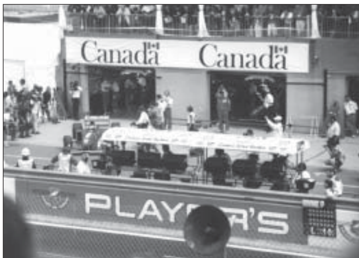
Deux jours avant le Grand Prix Player's , le gouvernement canadien a reculé de deux ans sur les restrictions aux commandites.

tifs. La controverse entourant la compensation pour les victimes de l'hépatite C n'y est sans doute pas étrangère : après avoir refusé des dédommagements pour une partie des victimes, les libéraux se voyaient mal offrir des millions de dollars aux différents festivals.