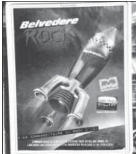
La publicité tous azimuts du Belvedere Rock se poursuivra pendant deux années supplémentaires.

Par contre, l'annonce du 3 juin prévoit un délai supplémentaire de deux ans