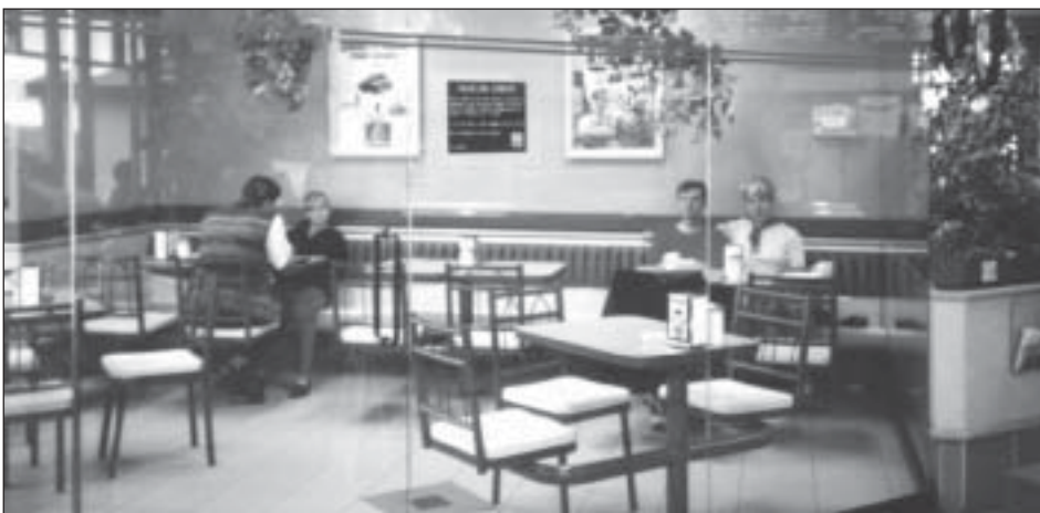
Plusieurs restaurants de la chaîne Tim Hortons , dont celui de Donnacona, disposent de salons cloisonnés et ventilés pour leurs clients fumeurs. Ils sont dix ans en avance sur le projet de loi !

Comme la loi fédérale, le projet de loi 444 permet la publicité dans les publications avec un lectorat comptant au moins 85 % d'adultes. La publicité autorisée, dans tous les cas, ne peut comporter autre chose que du texte et une illustration du paquet ; les slogans et toute association