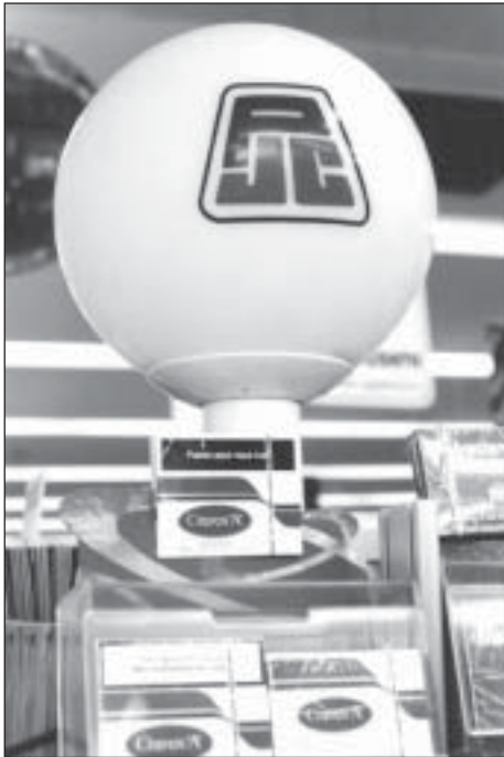
Les pharmaciens seront enfin dissociés du tabac, propose le gouvernement.

avec un style de vie sont interdits. Les produits dérivés (T-shirts, etc.) sont interdits.