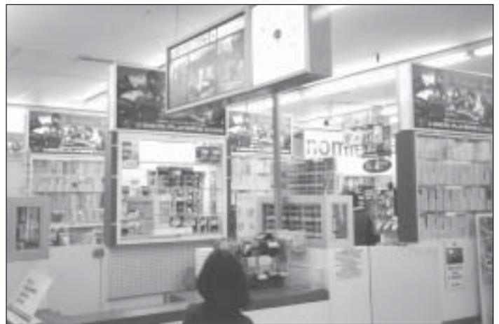
... Cependant, aux caisses de sa «section boutique», 13 affiches de commandites de tabac et 525 paquets exposés de face, encouragent fortement l'achat de cigarettes.