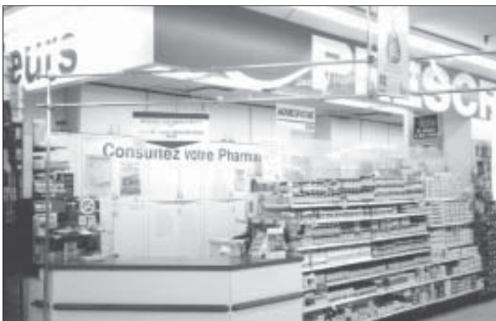
Les pharmacies sont séparées de leurs boutiques par des cloisons discrètes. À cette succursale Pharmaprix de la Plaza Alexis-Nihon, à Montréal, il est demandé de ne pas fumer devant le pharmacien...