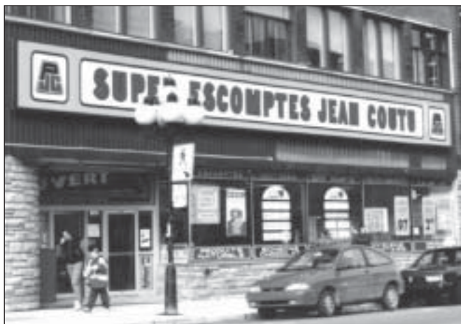
C'est à cette succursale appartenant à Jean Coutu qu'une inspectrice de l'Ordre avait acheté une cartouche de cigarettes en mars 1995.