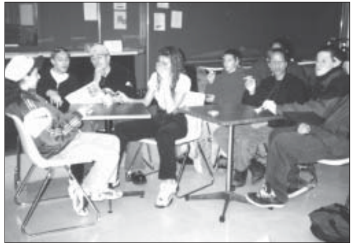
Presque tous les jeunes placés sous la garde des services sociaux sont ou deviennent fumeurs. ( Les ados sur cette photo sont des figurants. )

(FTE), et on n'avait pas fait grand-chose pour combattre le tabagisme juvénile. Mais il a fallu attendre l'été 1997 pour qu'un noyau d'employés non-fumeurs, en collaboration avec la direction, décide de s'organiser et d'exiger un milieu de travail sans fumée.