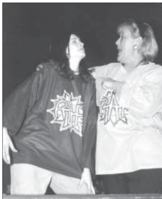
Les politiciens québécois acceptent de s'associer à la prévention du tabagisme juvénile, comme la ministre Pauline Marois au Rap Jeunesse en santé en Montérégie. Mais lorsqu'il s'agit des droits des non-fumeurs ou des stratégies de marketing de l'industrie du tabac, l'extrême discrétion semble de mise...

La « tolérance » québécoise par rapport aux méfaits de